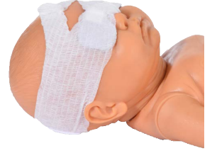
Uej Ãv| gto gf 'Yota