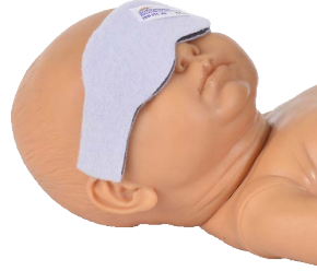
Uej Ãv| gto gf 'Sticker