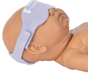
Uej Ãv| gto gf 'Mask