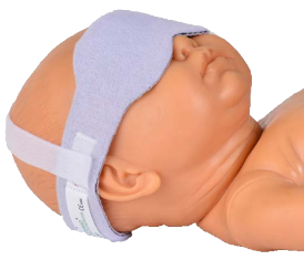
Uej Ãv| gto gf 'Mıruk